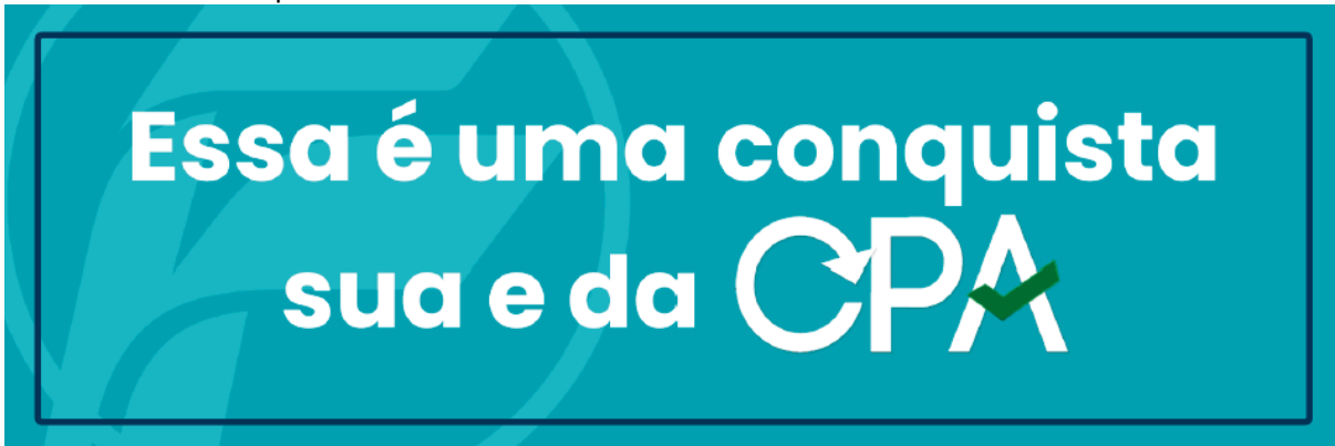
Figura 1: Selo de certificação indicando que aquele espaço / equipamento / reforma foi realizado com base no resultado das enquetes da CPA.

Por outro lado, os discentes não conhecem de forma suficiente os resultados das avaliações externas (abaixo de 50% - Tabela 1), caracterizando uma fragilidade. Como observado no Apêndice A, no triênio 2021 – 2023, apenas 11 dos 35 cursos da FAM (31,4%) passaram por avaliação externa, o que pode justificar os resultados encontrados. Após o recebimento do relatório sobre a visita in loco , a CPA realiza a análise dos indicadores e, junto com a direção e a coordenação de curso, divulgam os conceitos e principais comentários dos avaliadores. Notou-se no triênio que a porcentagem de satisfação em relação ao conhecimento desses dados é alta nos segmentos mais envolvidos na visita in loco , ou seja, coordenação, docentes e técnico-administrativo.