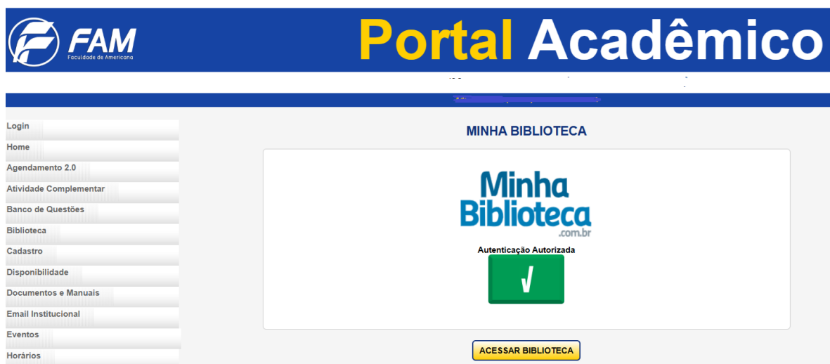
Figura 3 – Tela inicial de acesso à Minha Biblioteca, no Portal FAM.

Em 2025 a FAM assinou contrato com a empresa Minha Biblioteca Ltda, disponibilizando o acervo digital nas áreas de Ciências Exatas, Jurídicas, Pedagógicas, Sociais e Aplicadas, Letras e Artes e Saúde. O acesso ocorre pelo portal FAM (Figura 3). Na pesquisa, discentes e docentes avaliaram muito bem o acervo da Biblioteca Virtual, com médias acima de 4,0 (Tabela 6).