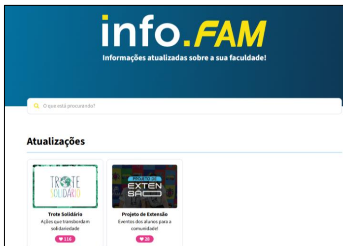
Figura 2 – Tela inicial do info.fam disponível no site da faculdade

A comunicação interna é bem avaliada por todos os segmentos (média acima de 3,5). As informações são divulgadas por meio do portal acadêmico, do site https://info.fam.br/ (Figura 2), do e-mail institucional (fam.edu.br), dos murais nos corredores e dentro das salas de aula, das mídias sociais e SMS.