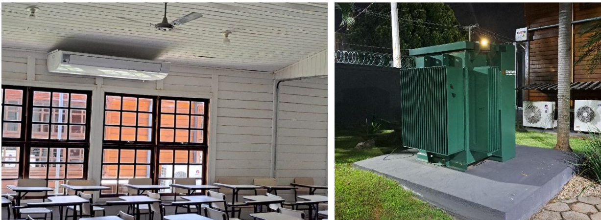
Figura 7 – Sala de aula com aparelho de ar condicionado instalado e subestação do bloco 2.

Com relação às políticas acadêmicas, em 2025 foi assinado um contrato com a empresa TOTVS para ampliar as ferramentas educacionais e melhorar a comunicação interna entre docentes, alunos e gestores, que deverá ser implantada a partir de agosto de 2026.